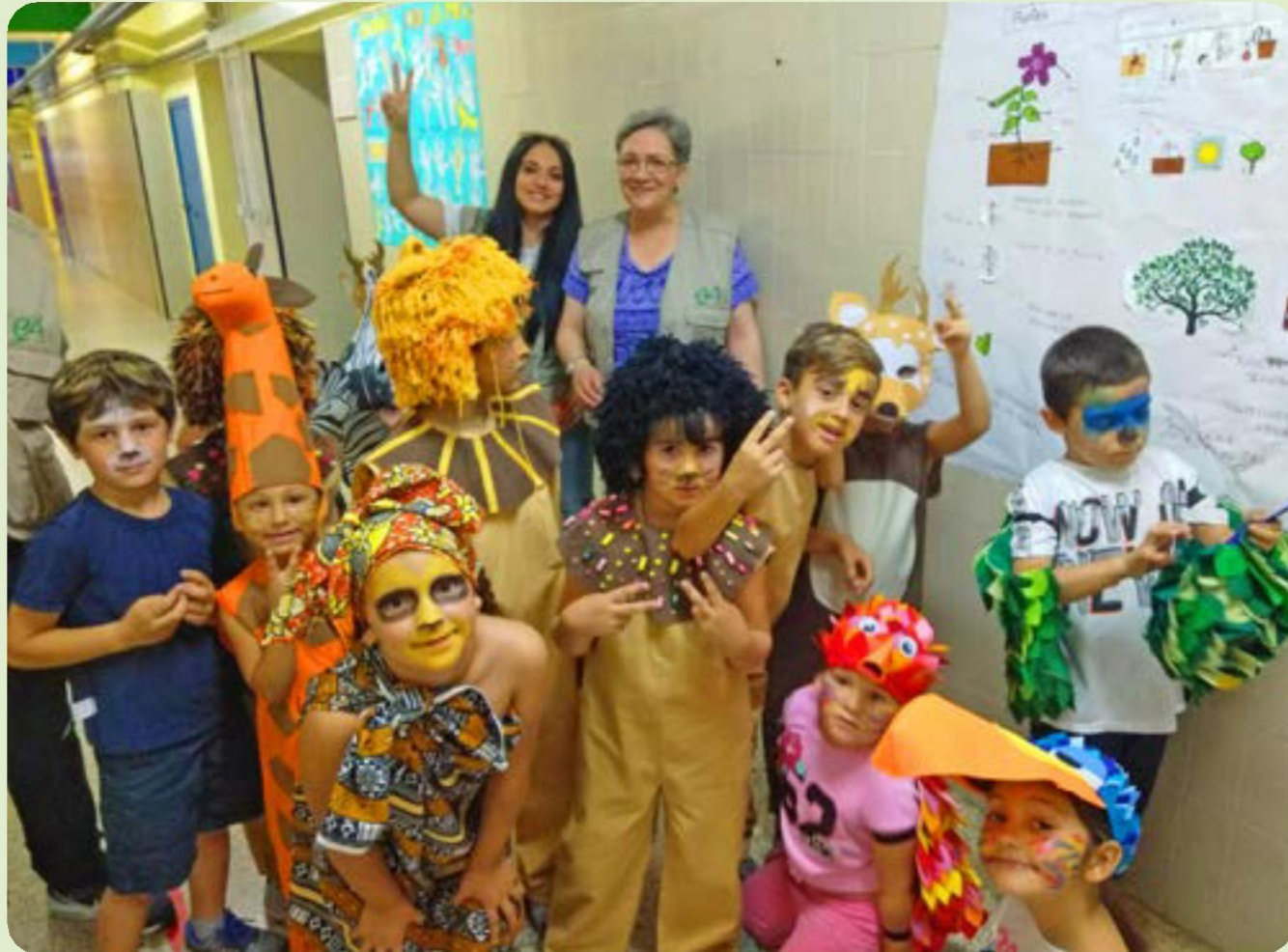
Musical del final de curso con la colaboración del taller de costura de las mujeres.