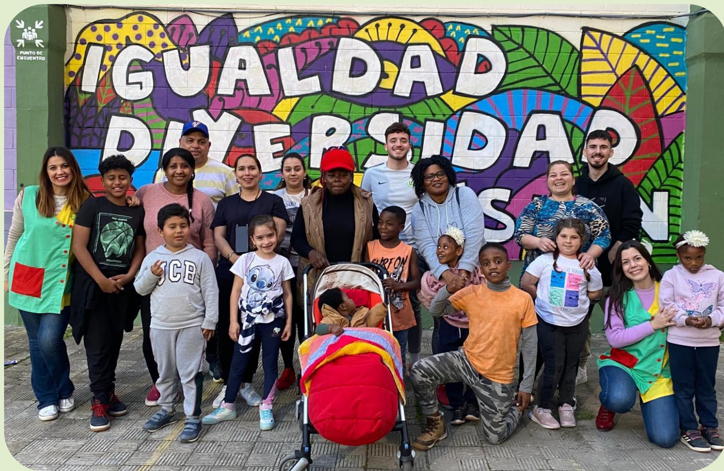
Actividades extraescolares de la Asociación Entre Amigos en los colegios del barrio.