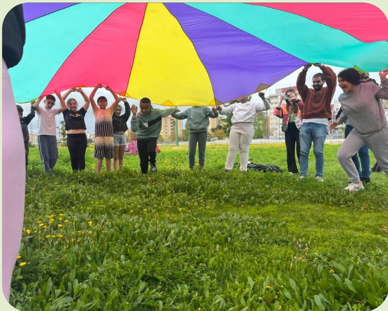
Actividades de tránsito escolar con alumnado de primaria y secundaria.