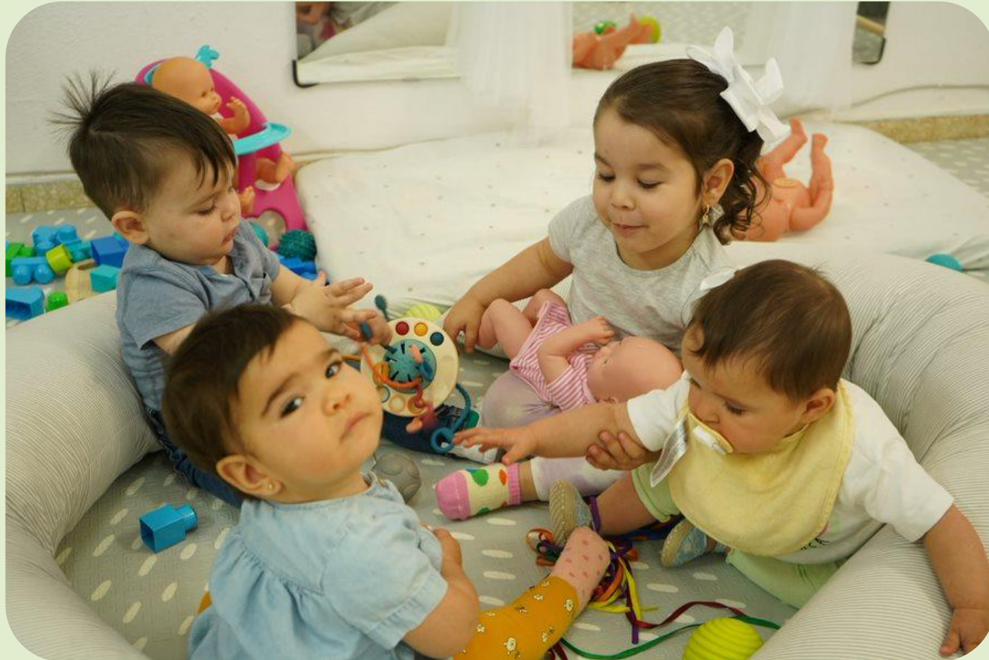
Talleres educativo parentales del proyecto 0-3