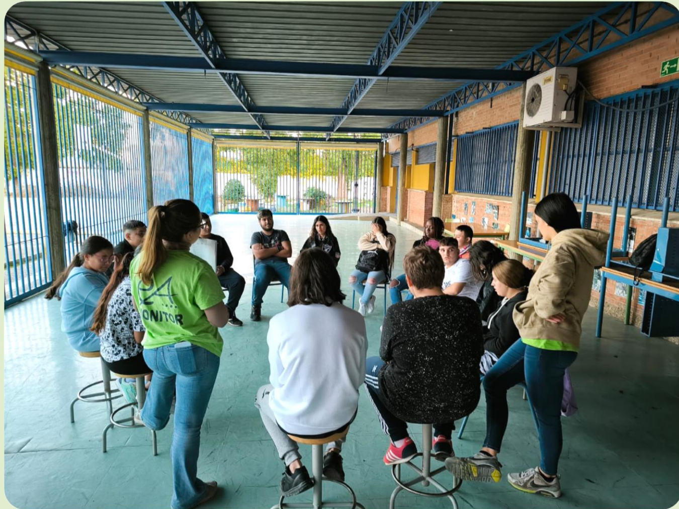
Actividades extraescolares en el IES Joaquín Romero Murube