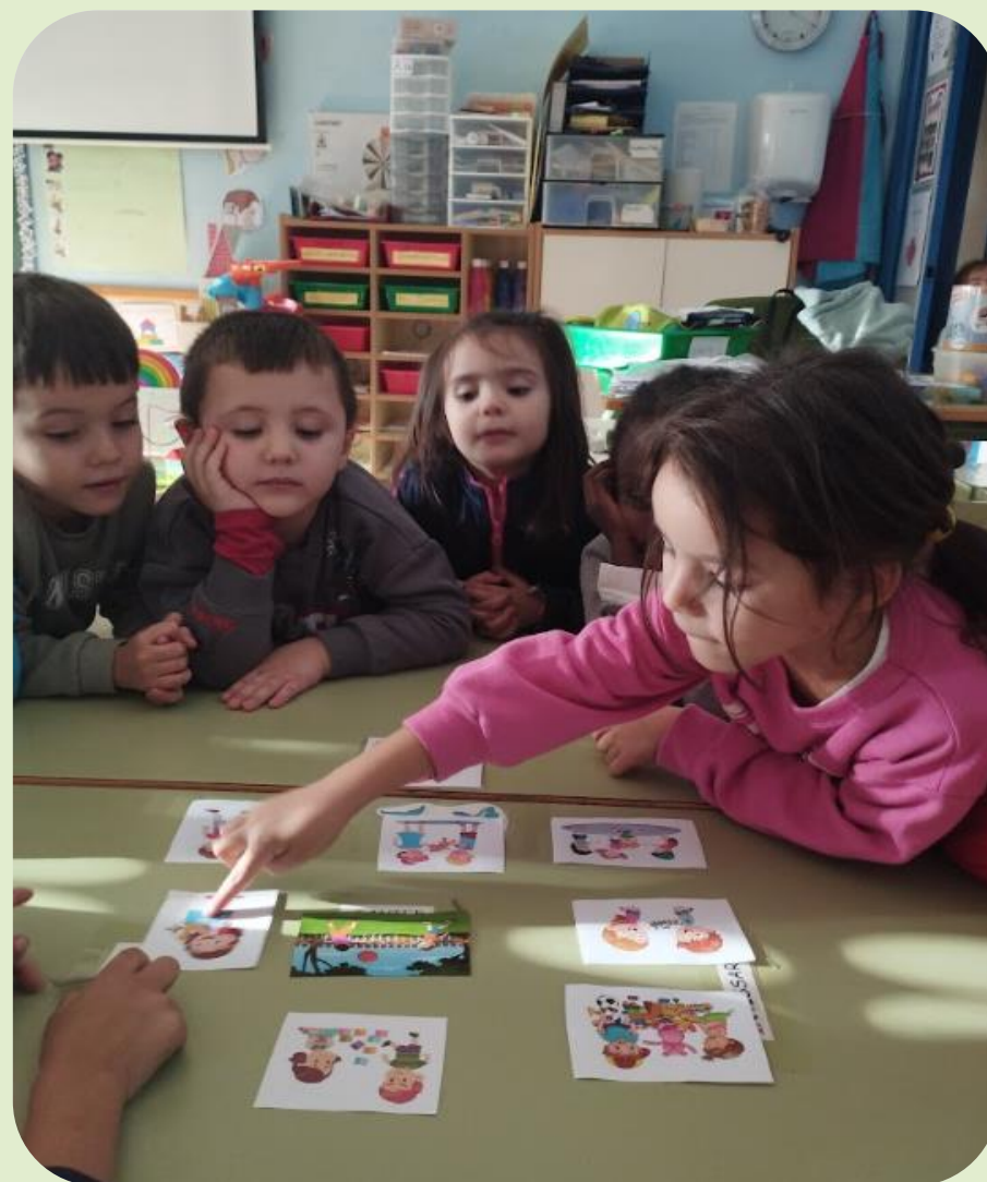
Sesiones de igualdad en los talleres extraescolares