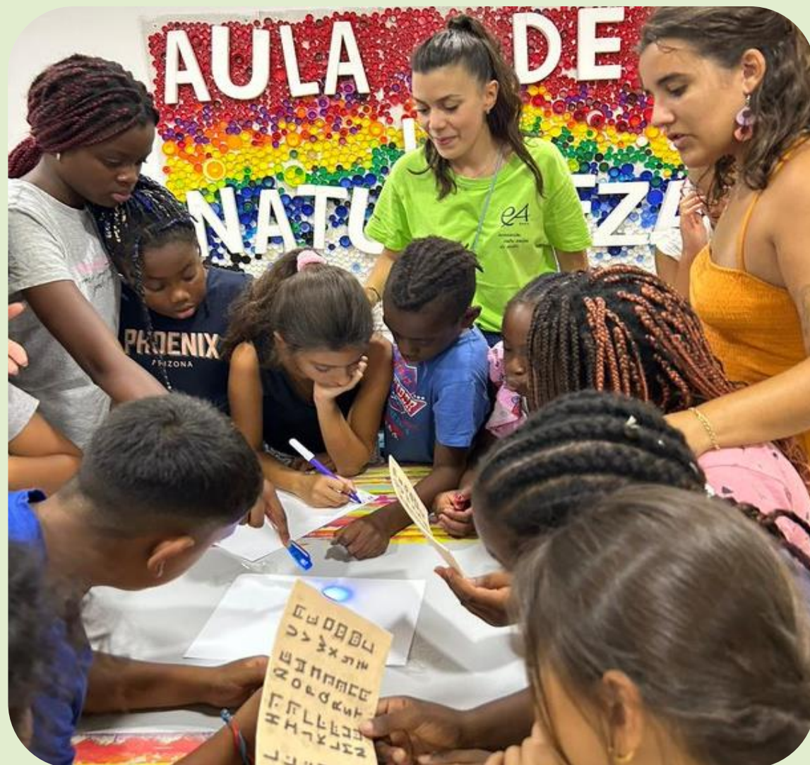
Actividades en el Aula de la Naturaleza