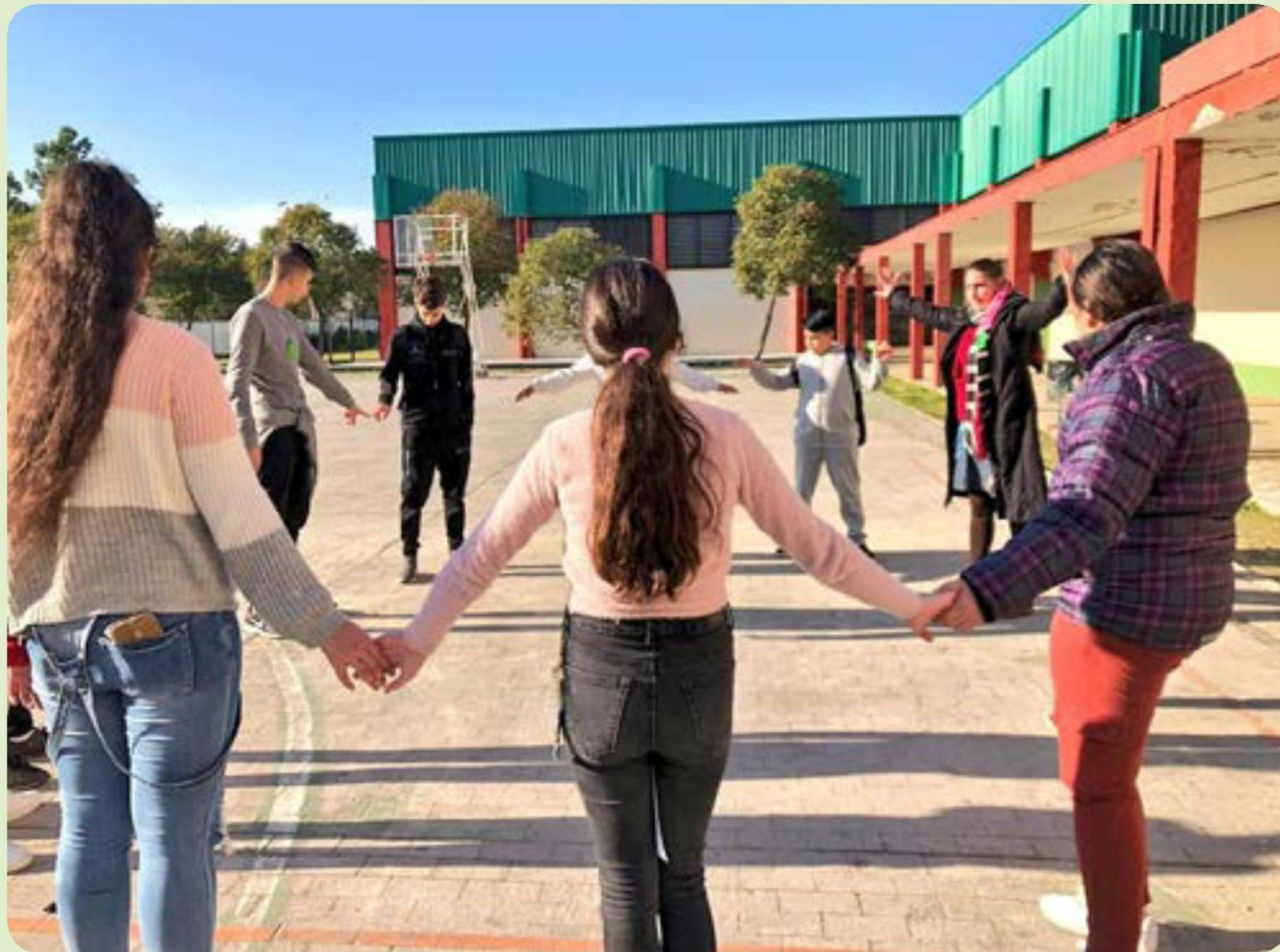
Actividades extraescolares en el IES Polígono Sur.