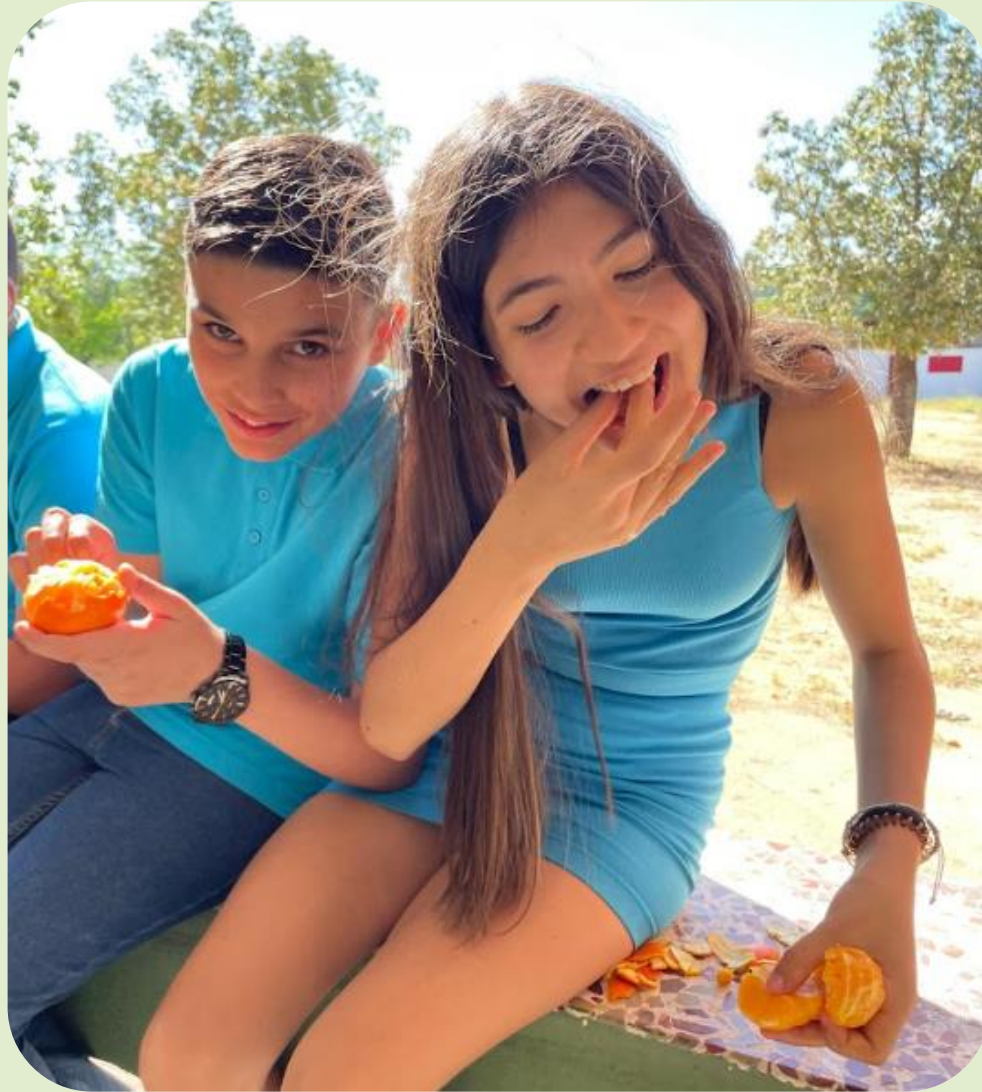
Meriendas saludables en nuestras actividades extraescolares