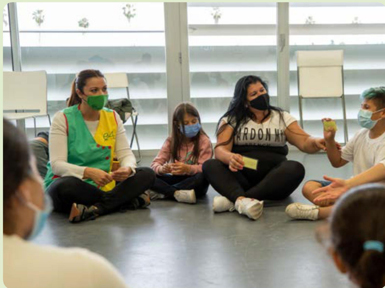
Taller filio-parental de la Asociación Entre Amigos en la factoría cultural.