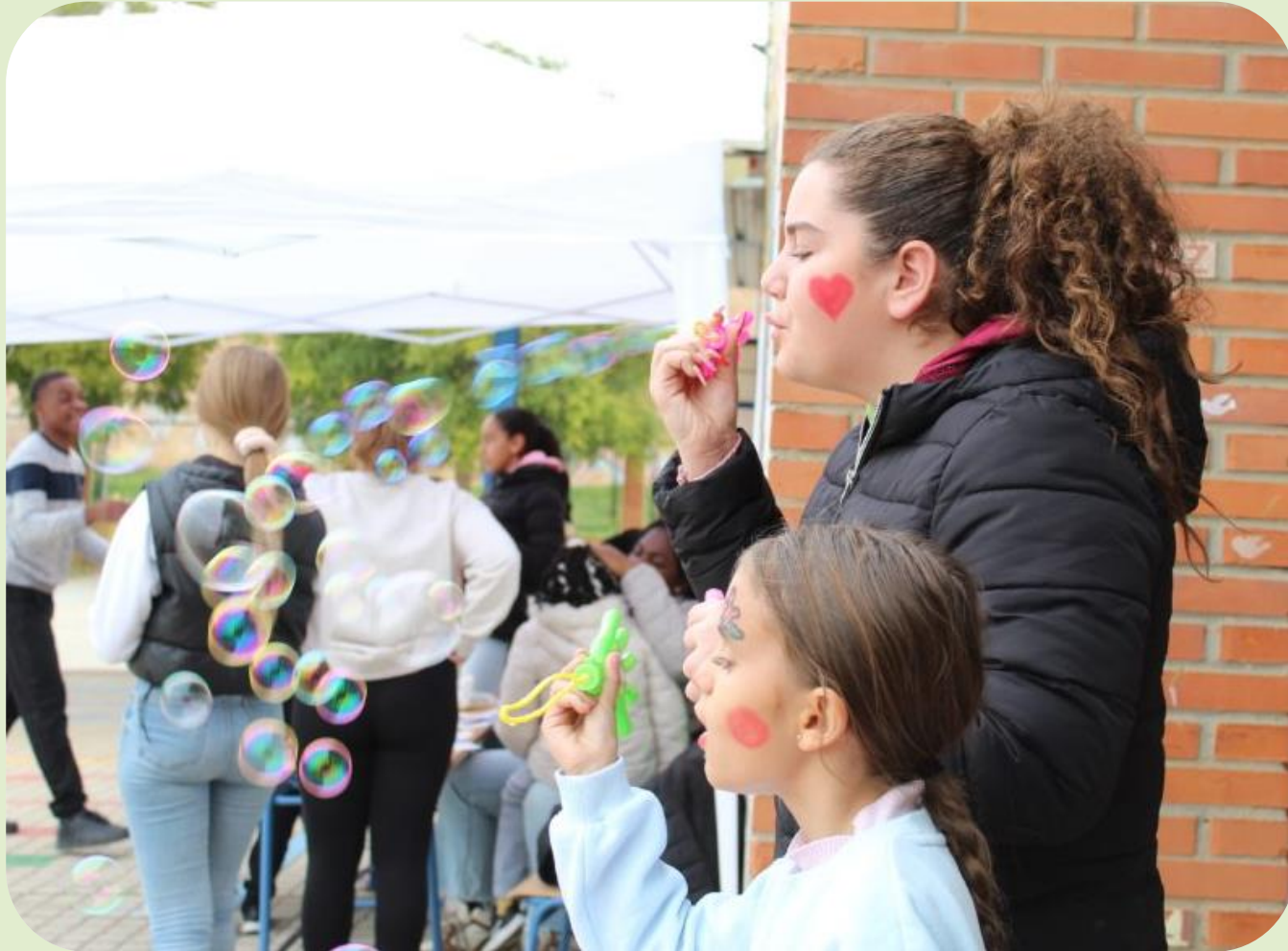
Actividades de tarde en el CEIP Paz y Amistad

La organización está compuesta por más de mil personas (profesionales, voluntariado, socios, socias y otras personas colaboradoras) comprometidas con la defensa de los derechos de los niños, niñas y adolescentes de Polígono Sur.