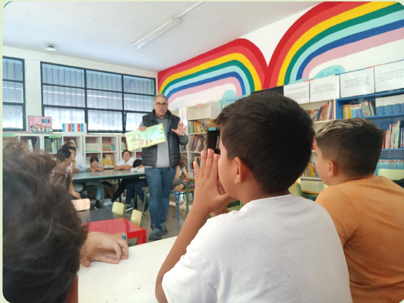
Actividad de cuentacuentos en colaboración con otras entidades