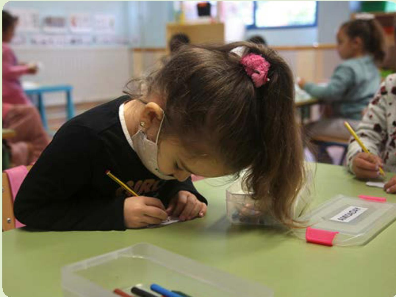
Taller de escritura en las tardes de refuerzo educativo.