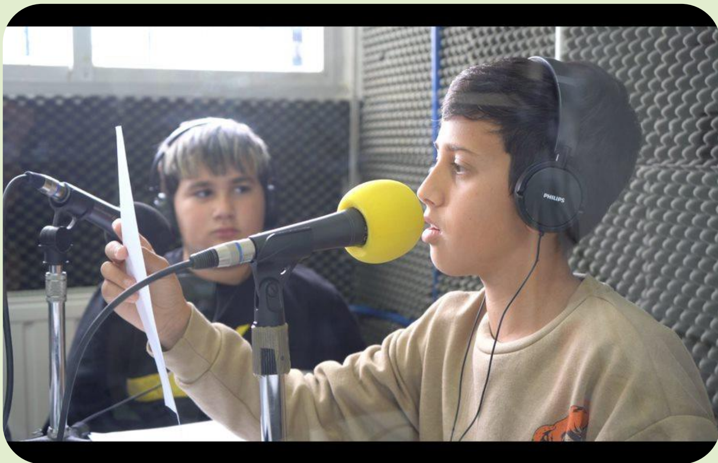
Grabación en la radio comunitaria del CEIP Andalucía.