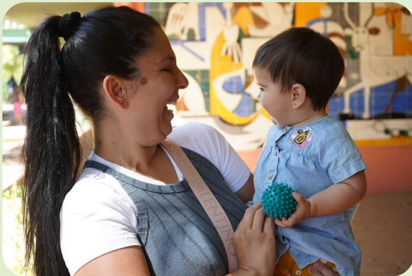
Familia usuaria de las escuelas de madres y padres.