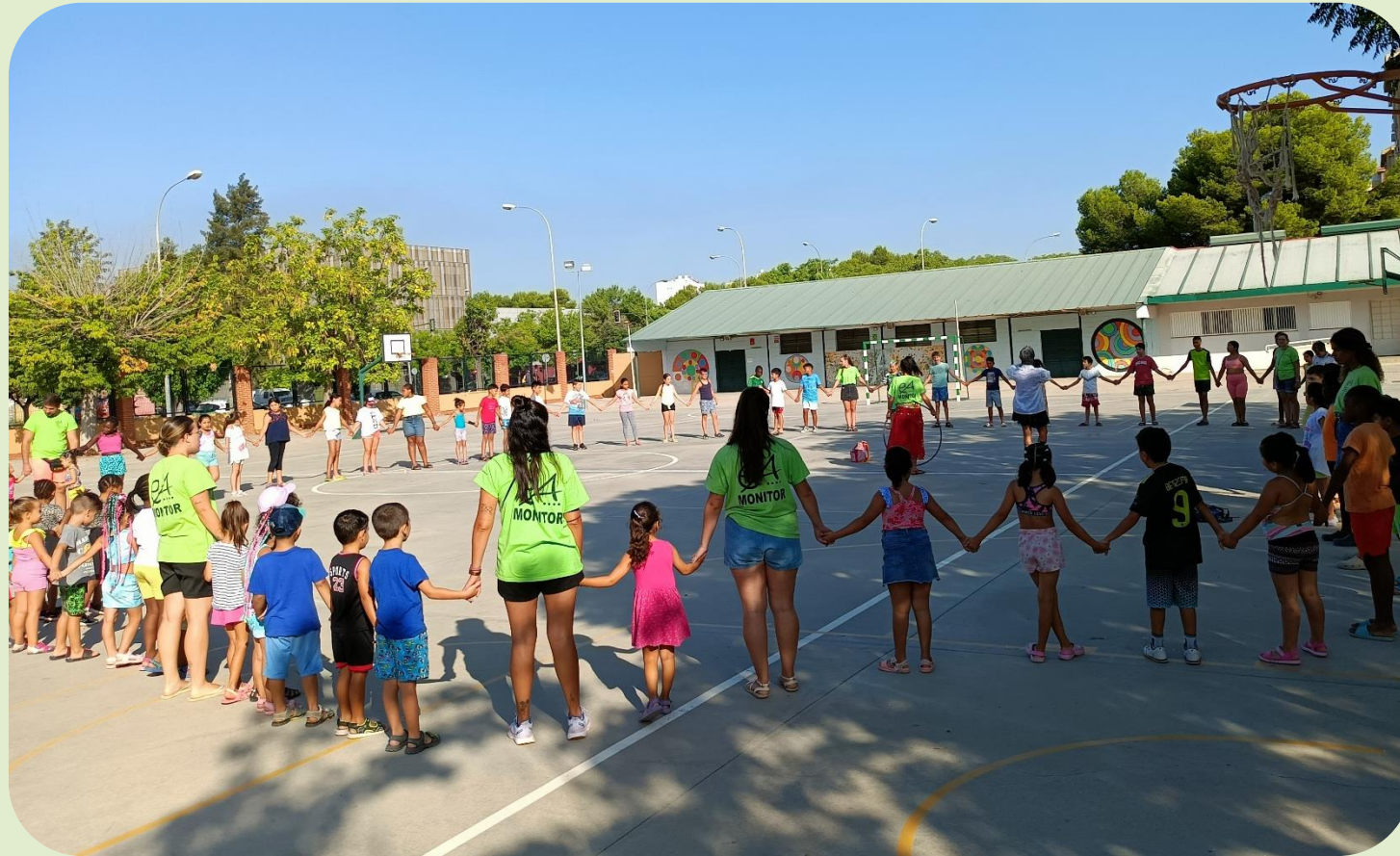
Actividades cooperativas en nuestras actividades extraescolares.