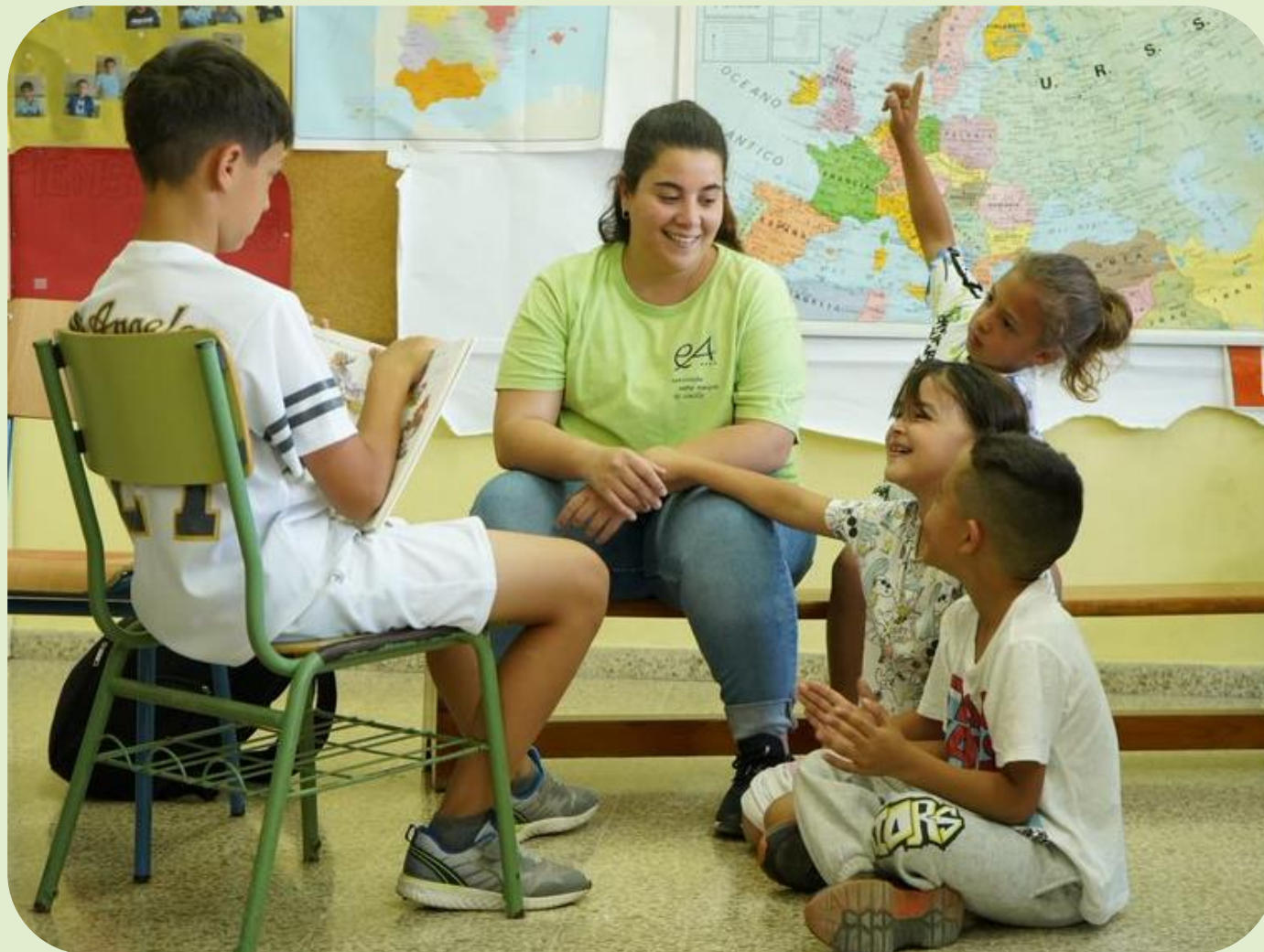
Refuerzo a la lectura en las actividades extraescolares del CEIP Andalucía