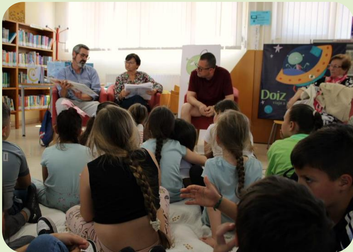
Encuentro intergeneracional entre el club de la lectura y menores del CEIP Manuel Altolaquirre