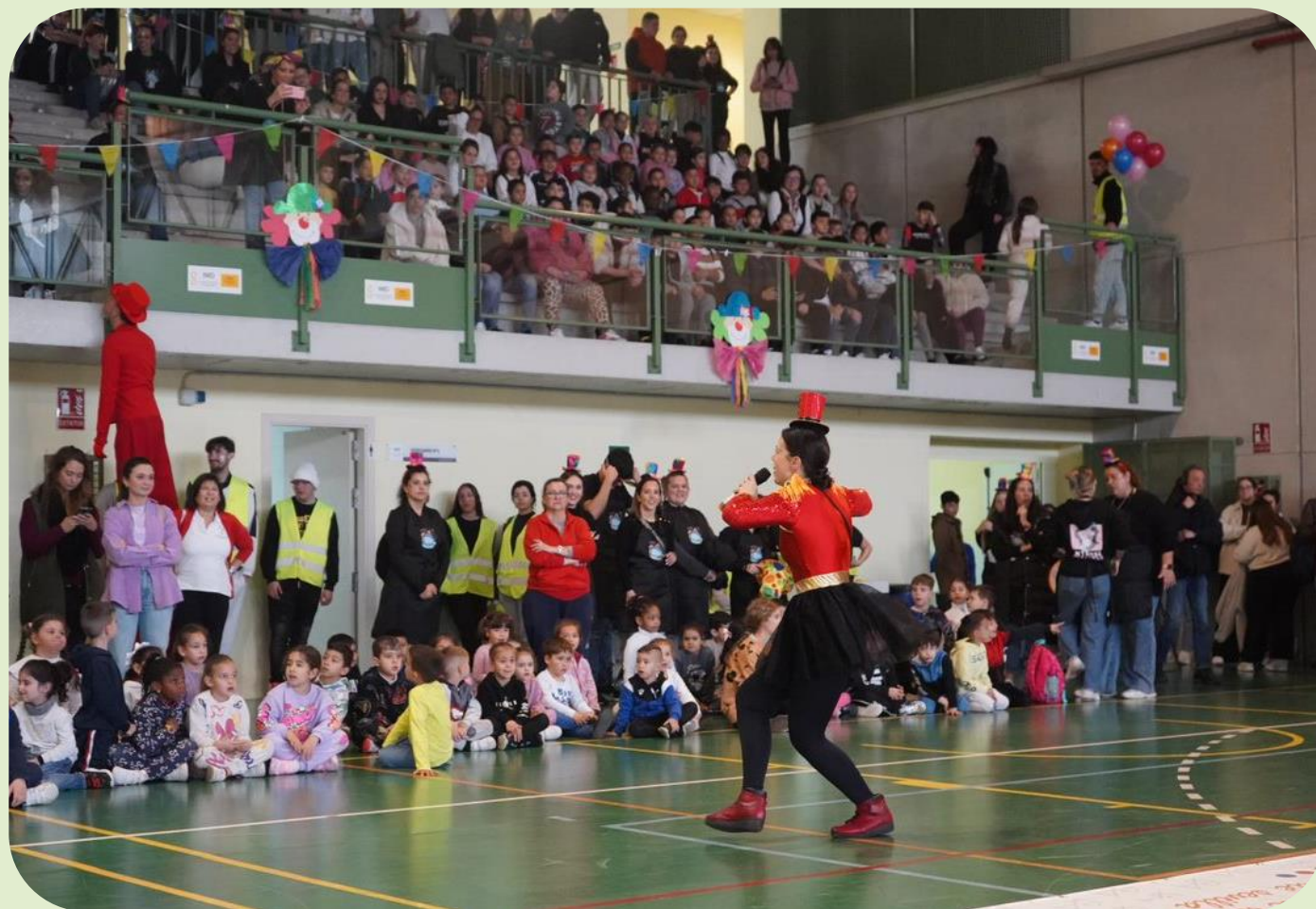
Bienvenida a la I Feria de la Felicidad; por el derecho al juego