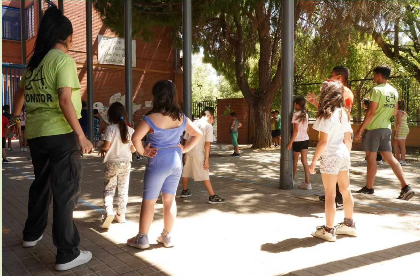
Juegos populares en el CEIP Paz y Amistad

Por un lado, permite evaluar si se han logrado los objetivos previstos y si las acciones implementadas están generando un impacto positivo. Además, facilita la solicitud y recepción de retroalimentación sobre las intervenciones, ofreciendo datos fundamentados para la toma de decisiones.