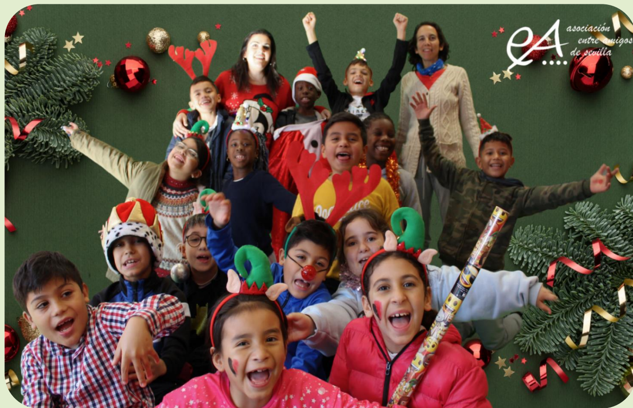
Felicitación de escuela de navidad en el CEIP Paz y Amistad