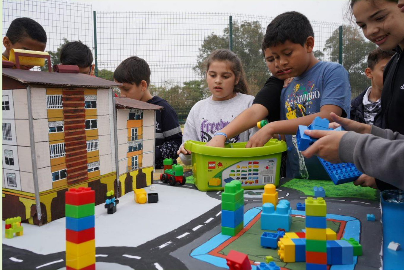
Jugando con una maqueta del Polígono Sur en la I Feria de la Felicidad