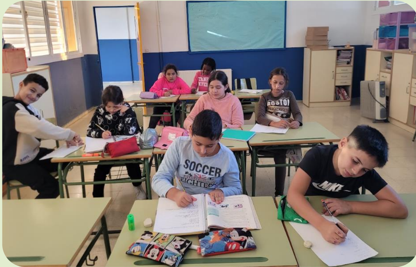
Talleres de refuerzo escolar en el CEIP Cristóbal Colón