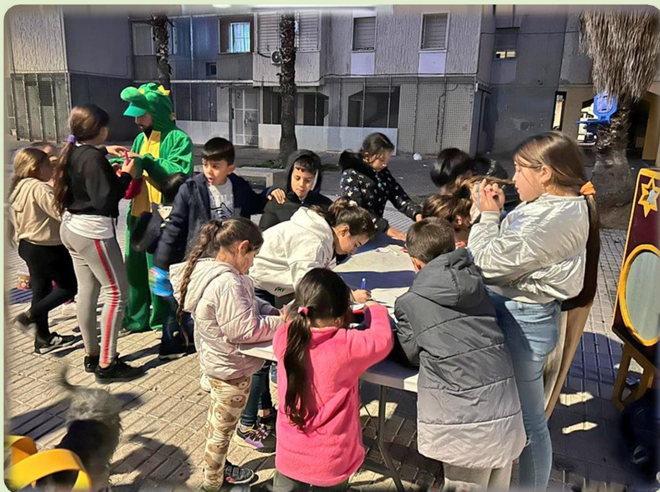
Actividades comunitarias en plazoletas de Polígono Sur

Todas las formas de maltrato tienen repercusiones sobre el área psicológico-emocional del niño o niña. El MALTRATO EMOCIONAL se define como toda acción, omisión o negligencia de carácter afectivo, capaz de originar cuadros psicológicos-psiquiátricos que afecten a las necesidades del niño o niña, según los diferentes estados evolutivos y características