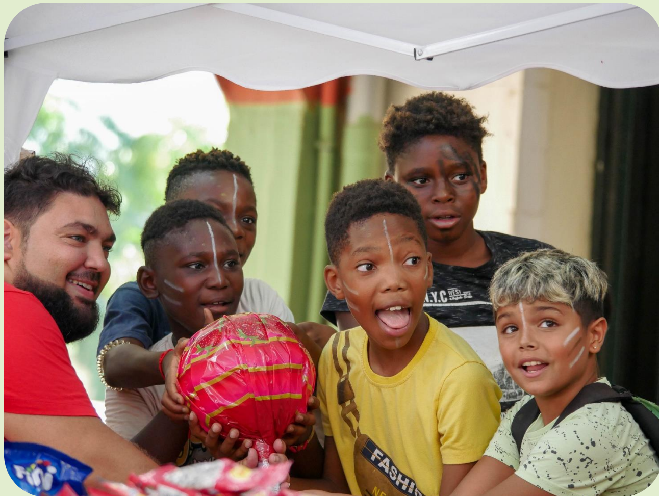
Fiesta final con todos los niños y niñas de escuela de verano