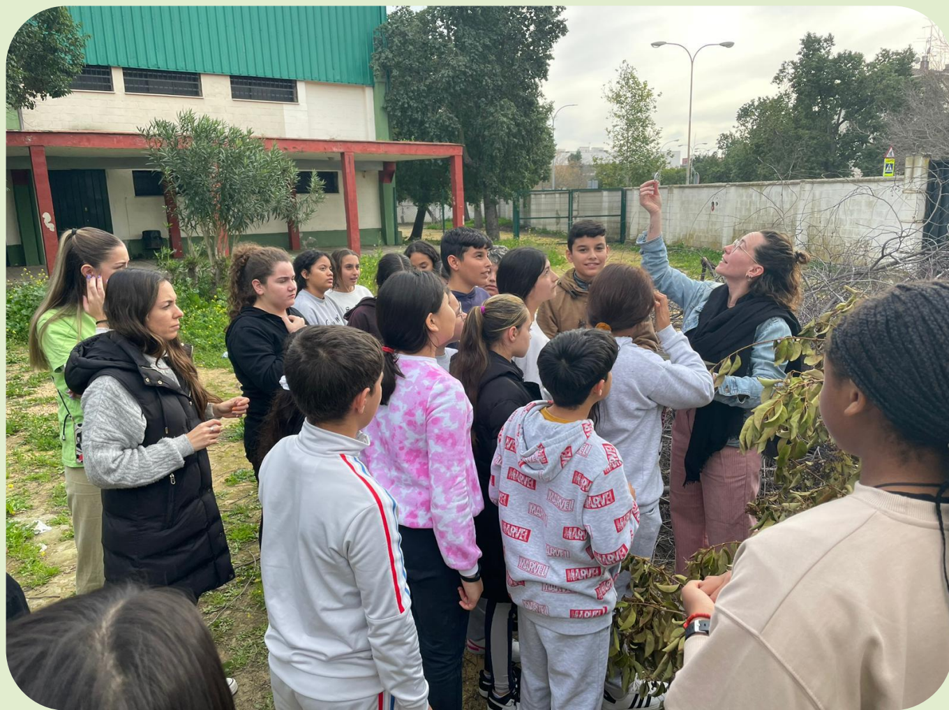
Encuentros entre alumnado de 6º de primaria y secundaria para el tránsito escolar.