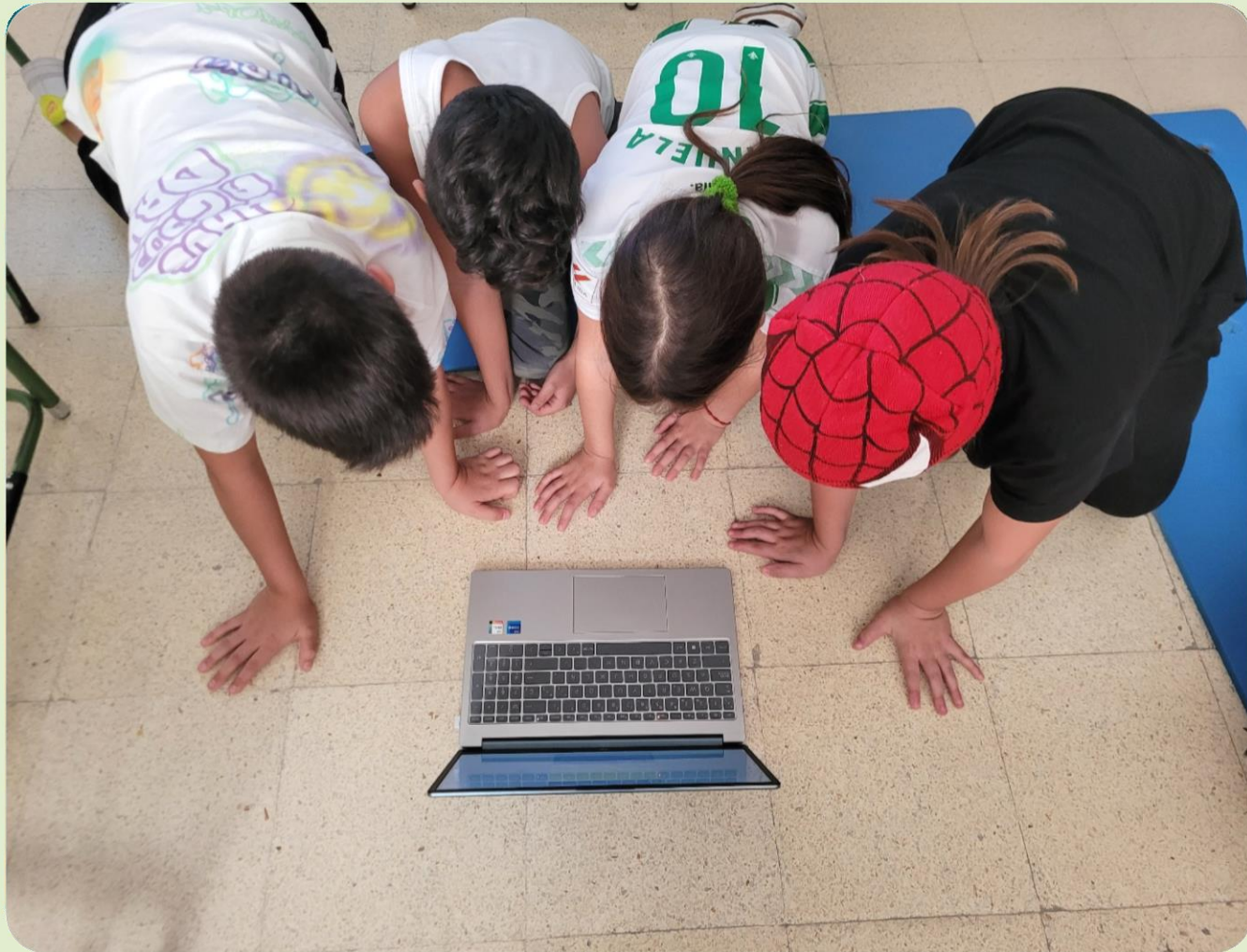
Actividades extraescolares en el CEIP Cristóbal Colón.