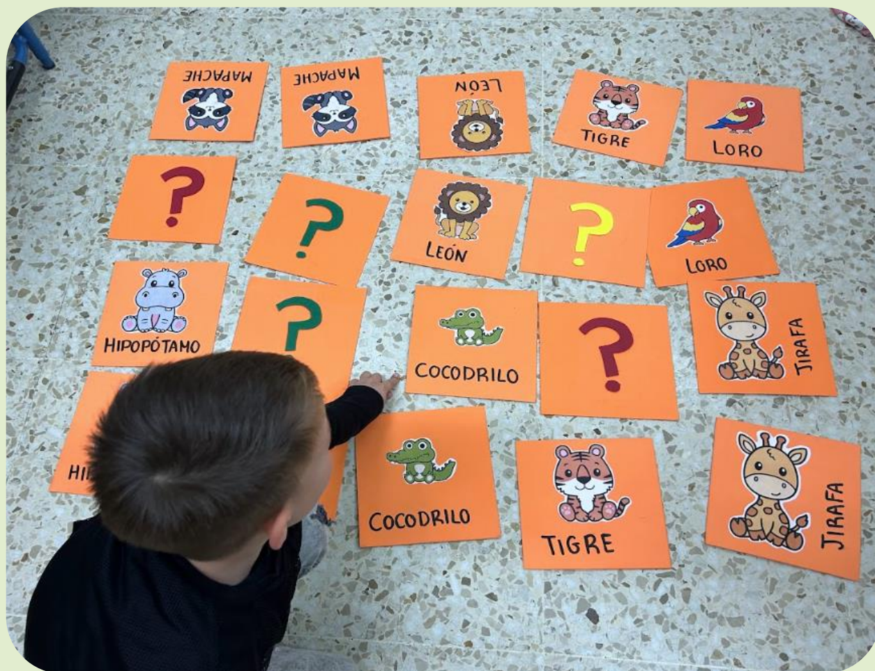
Actividades lúdicas y educativas en el CEIP Manuel Altolaguirre