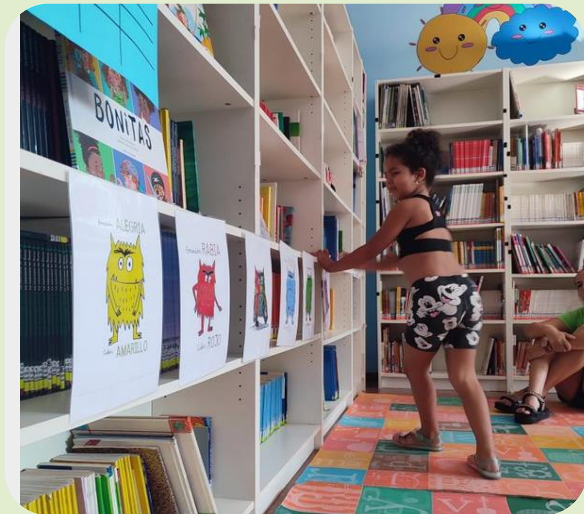
Actividades de educación emocional.