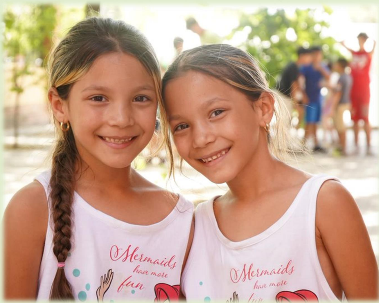
Actividades en las plazoletas de Polígono Sur.