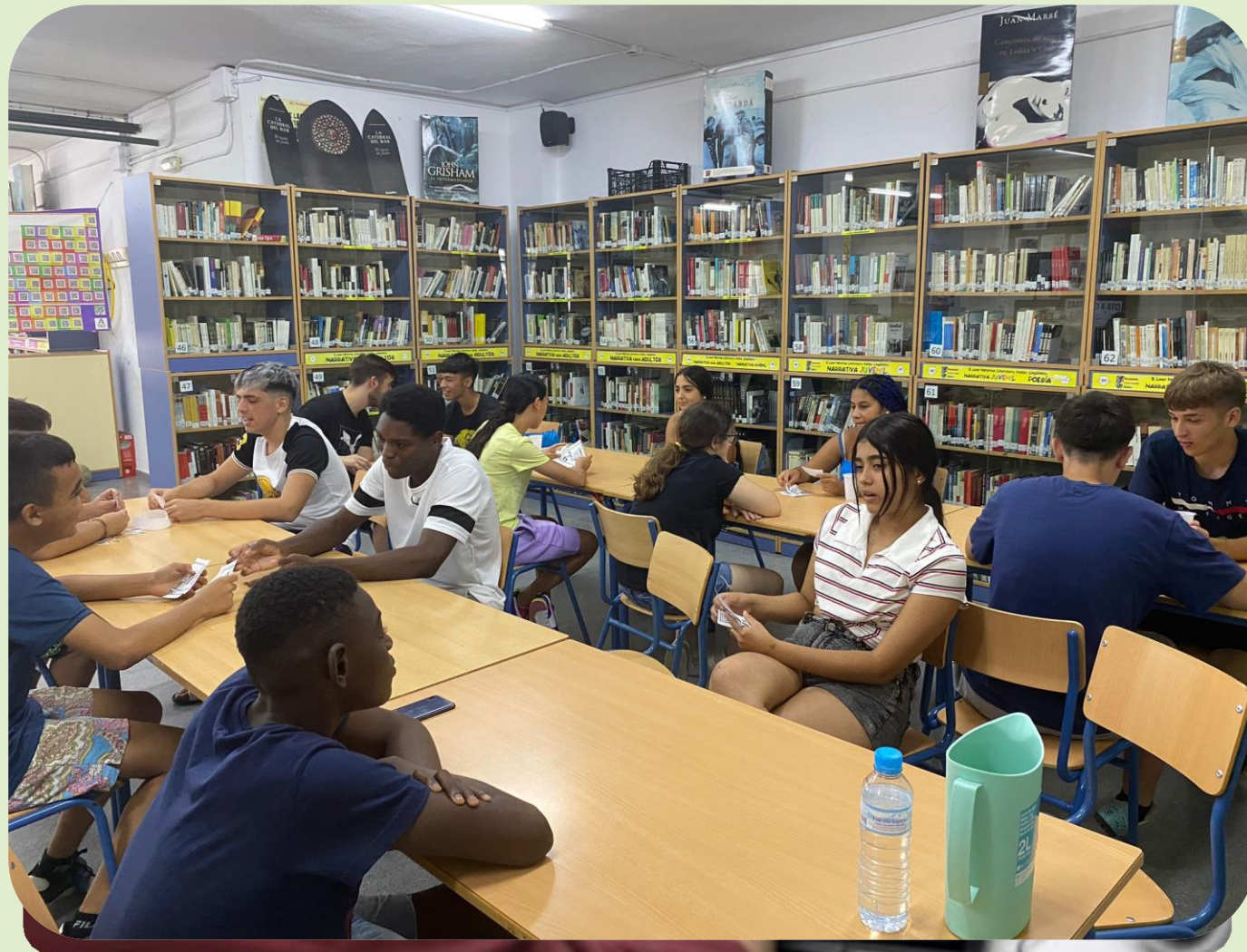
Actividades de cohesión grupal en el IES Polígono Sur.