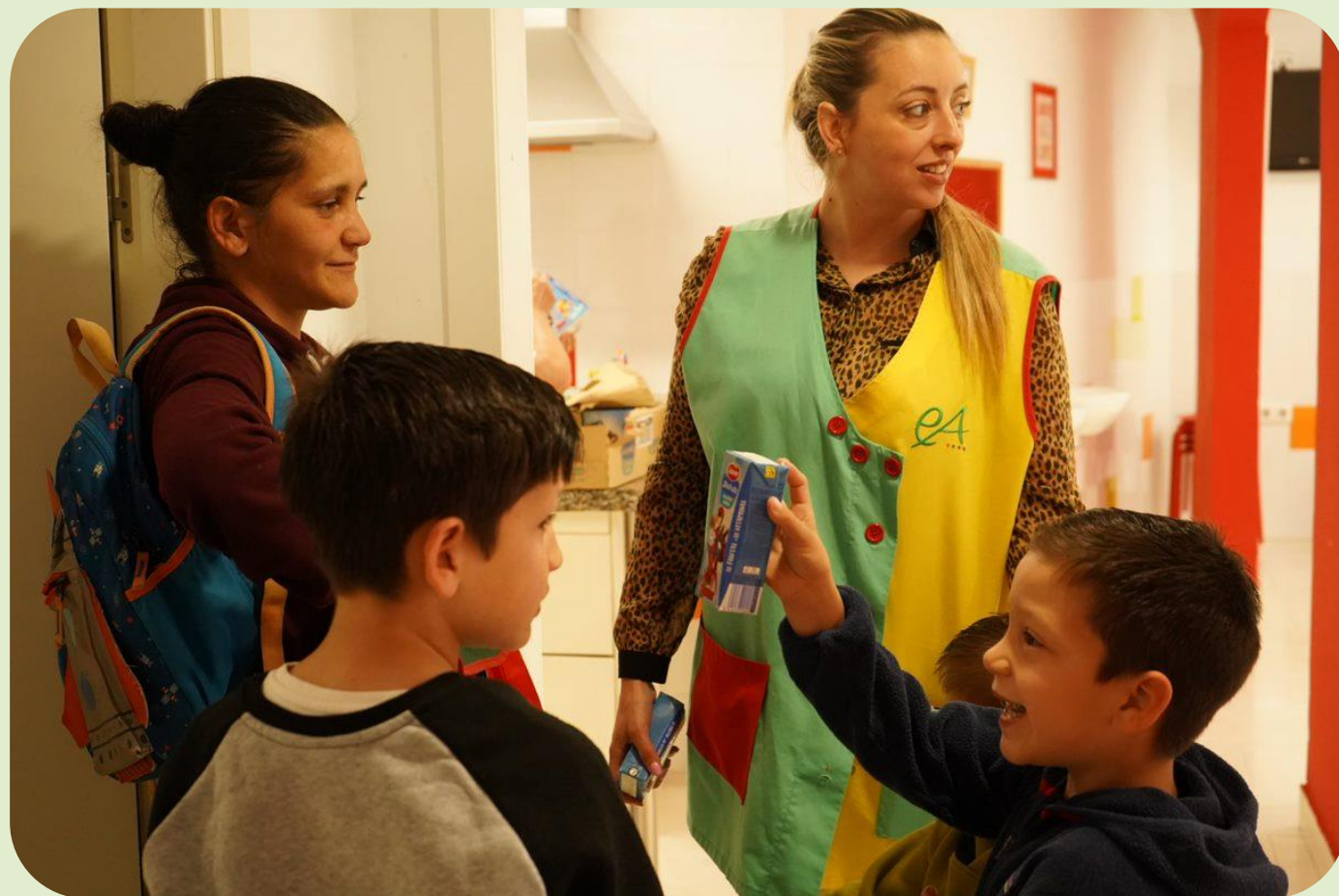
Familia atendida en el centro de día.